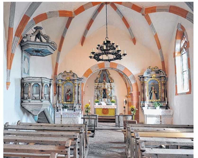
Bilder oben: Die katholische Pfarrkirche Apollonia ist das Wahrzeichen von Gransdorf. Bild unten: Am Brunnen des Dorfplatzes ist das Gemeindepappen in die Steinmauer eingearbeitet.