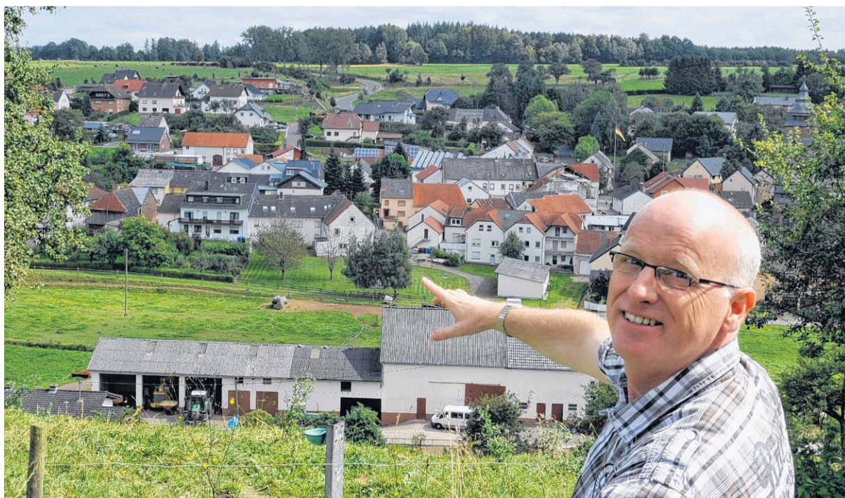
Ortsbürgermeister Friedebert Spoden kennt die schönsten Aussichten auf seine Gemeinde.