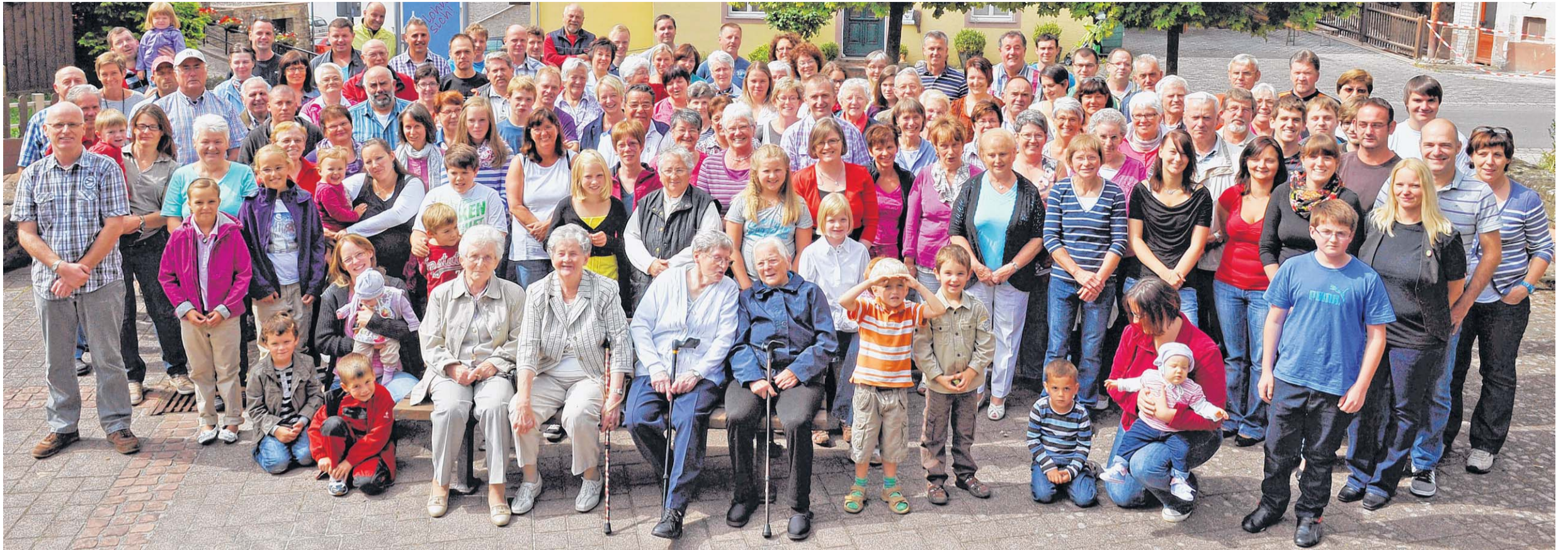
127 Gransdorfer haben an der Dorffoto-Aktion in ihrem Ort teilgenommen. Dafür bekommen sie jeweils ein großes Foto zur Erinnerung und sind auf einem noch größeren Bild im Bürgerhaus verewigt.